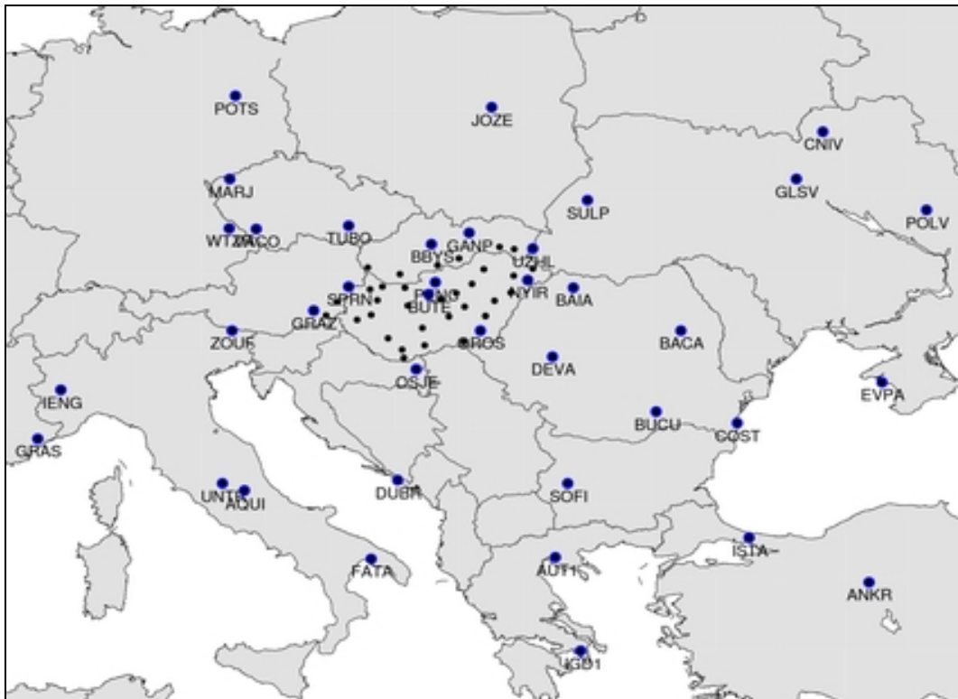
1.ábra A GPS feldolgozásba bevont EPN és GNSSnet.hu állomások

A mérési anyagból az ETRS89 koordinátákat a következő lépésekben vezettük le: